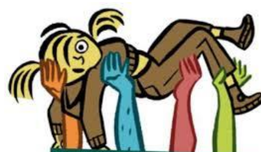
De Verwijsindex Noord-Holland

In het belang van uw kinderen en onze leerlingen willen we voorkomen, dat we niet op de hoogte zijn van zorgen om uw kind bij andere instanties. Daarvoor is een landelijk instrument (de verwijsindex) beschikbaar waar wij als school gebruik van maken. Wanneer wij ons zorgen maken over een kind en vermoeden dat meerdere partijen bij de zorg betrokken zijn, is het voor de verdere voortgang van belang om elkaar daarvan op de hoogte te stellen. Dat doen wij als school niet zomaar; we besluiten tot een melding in de verwijsindex als wij dat voor de verdere ondersteuning van uw kind en na bespreking in het ondersteuningsteam noodzakelijk achten. U als ouder wordt hiervan altijd op de hoogte gesteld. Op deze manier kunnen wij met een gezamenlijke en afgestemde aanpak de beste ondersteuning voor uw kind regelen.